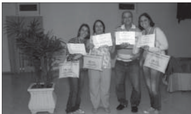
Certificado nas mãos, mil idéias na cabeça e disposição renovada para trabalhar para o Senhor: é a experiência de quem participa do EntreLíderes