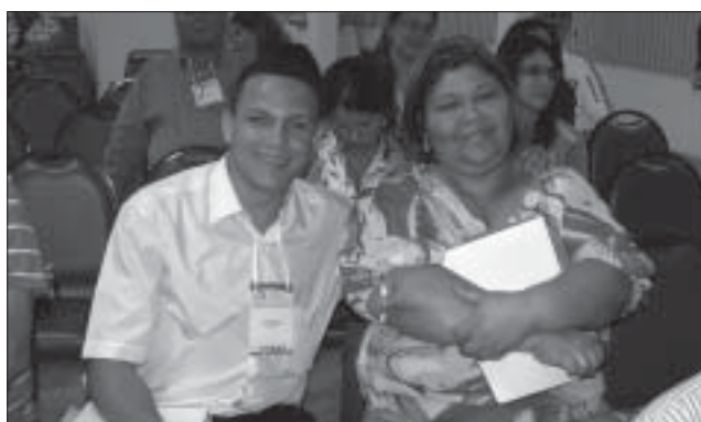
Com a participação de um expressivo número de pastores o EntreLíderes se consolidou como uma ferramenta voltada para equipar quem ministra