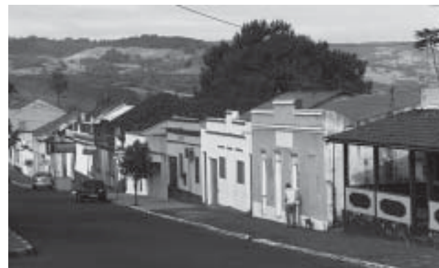
Casario em Santo Antonio da Patrulha: herança da colonização luso-açoriana

Da Redação do site da Junta de Missões Nacionais