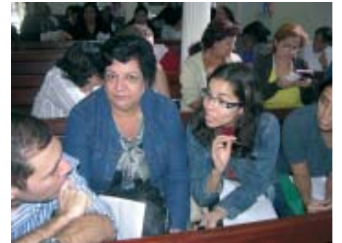
Como parte da proposta da Clínica, os participantes tiveram várias oportunidades para debater as idéias