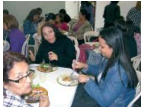
No intervalo entre os Módulos de Faixa Etária e as Oficinas a Igreja serviu um saboroso almoço a todos