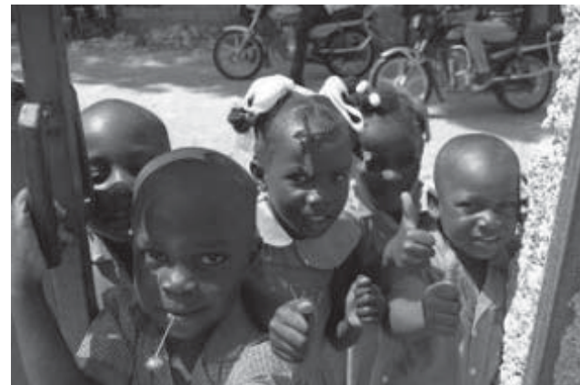
Crianças haitianas atendidas pelo PEPE: esperança de dias melhores