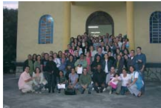
Com quase duzentos participantes, a 13ª Clínica de EBD foi realizada pelo CJC, em parceria com a Igreja Presbiteriana Independente do Rio de Janeiro, no último dia três de setembro

Para obter mais informações sobre a Clínica ou fazer sua inscrição: Ligue: (21) 2516-6080 Consulte: www.juventudecrista.com.br