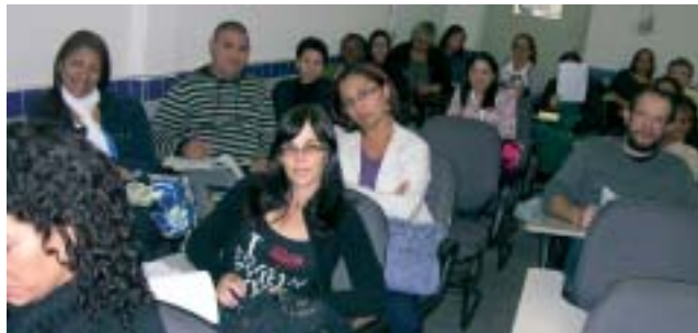
Atentos, participantes da Clínica acompanham as orientações do preletor

Próximas Clínicas – As próximas Clínicas agendadas são: 14ª Clínica de EBD - Dias 25 e 26 de novembro, no templo da 1ª Igreja Batista Monte Horebe, em Campo Grande e 15ª Clínica de EBD - Dias 23 e 24 de março de 2012, no templo da Igreja Batista em Vila Jaguaripe, Magé.