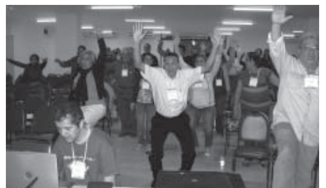
Nas oficinas, além do sólido conhecimento teórico e prático, foram oferecidas dinâmicas e atividades interativas visando a integração e o envolvimento

Comece a preparar-se desde agora! Vem aí o 5º EntreLíderes