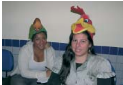
A Oficina de uso de fantoches proporcionou aos professores uma rica oportunidade de vivenciar as possibilidades desta poderosa ferramenta de ensino