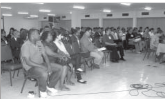
O interesse e a motivação dos participantes, com a atenção voltada para o tema do EntreLíderes mostrou a relevância e a seriedade da sua proposta