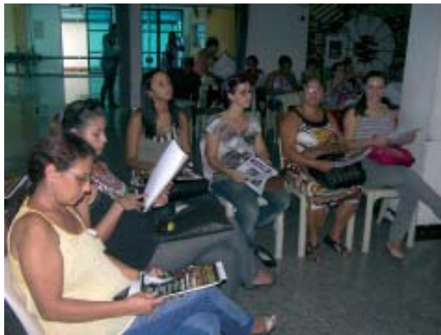
Participantes da 12ª Clínica realizada no templo da 1ª Igreja Batista de Campo Grande, em março deste ano examinam o kit didático

Parceria: A 14ª Clínica será realizada em parceria com a Igreja Batista Monte Horebe nos dias 25 e 26 de novembro, com abertura às 18h da sexta-feira. O endereço da Igreja é Rua Benedito Lacerda, 235 em Campo Grande, Zona Oeste da cidade do Rio de Janeiro. Informações e inscrições: (21) 2516-6080 ou www.juventudecrista.com.br .