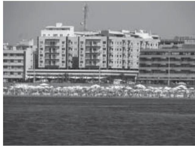
A Praia do Forte, cartão postal de Cabo Frio é onde está localizada o Malibu Palace Hotel, onde será realizado o 4º EntreLíderes