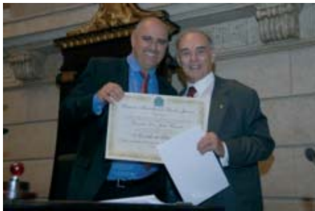
A entrega do Diploma ao Deputado Arolde: a felicidade de ser reconhecido pela cidade que adotou

Emocionado, o Deputado declarou: “Quero agradecer todos que vieram aqui nesta tarde de segunda-feira. Eu não quero chorar. Não que eu tenha problema com choro, mas quero agradar todos que aqui se encontram”. E emendou: “Senhoras e senhores, estou recebendo este título com enorme prazer. Eu não sou carioca, mas acreditava ser, até